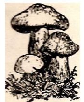
Altes PV Logo

Sehr geehrte Gäste, sehr geehrte Gönner und Spender, sehr geehrte Damen und Herren, Der Verein für Pilzkunde Grenchen und Umgebung freut sich, Ihnen zum Anlass des 100 Jahre Jubiläums, eine Ausstellung in einem neuen Kleid an einem neuen Ort zu präsentieren. Das Datum war schon seit zwei Jahren reserviert, einiges geplant, einfach schieben war nicht möglich. Wir haben nun in der Mehrzweckhalle Büelen in Bettlach optimale Bedingungen für unseren Anlass gefunden. Alle unsere Mitglieder geben sich Mühe Ihnen eine interessante Präsentation eines Teils unserer in Europa heimischen Pilze zu zeigen. Die ausgestellten Exemplare haben wir versucht, einigermaßen naturgerecht darzustellen. Wenn das Wetter mitspielt werden Sie bei uns ungefähr 300 verschiedene Arten bestaunen können. Sollten Sie an der Ausstellung Fragen haben, zögern Sie nicht unsere Experten vor Ort anzusprechen. Die Pilzkontrolleure der Gemeinden Lengnau bis Bettlach rekrutieren sich übrigens aus unserem Verein. Natürlich können Sie auch Ihre gesammelten Pilze zur Kontrolle vor Ort vorweisen. Nach Ihrem Rundgang durch die Ausstellung freut es uns, wenn Sie das Pilzlerrestaurant besuchen. Die Küchenbrigade wird Sie mit Pilzspezialitäten verwöhnen. In der Kaffeestube werden Sie unsere hausgemachten Kuchen zu einem guten Pilzlerkaffi geniessen können. Es freut uns, wenn Sie unseren Anlass in guter Erinnerung behalten. Herzlich willkommen an unserer Jubiläumsausstellung.