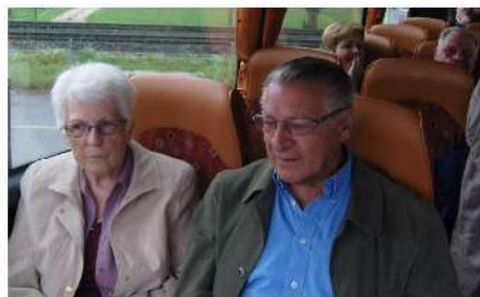
Erdmannshöhle Hasel Samstag 21. Juli 2012